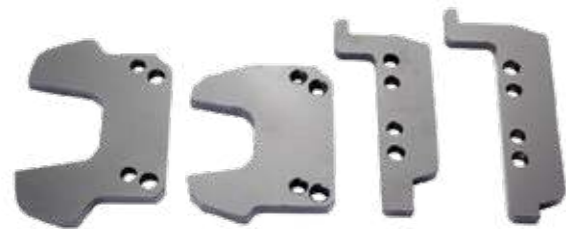
Passende Adapter für jedes Schienenprofil