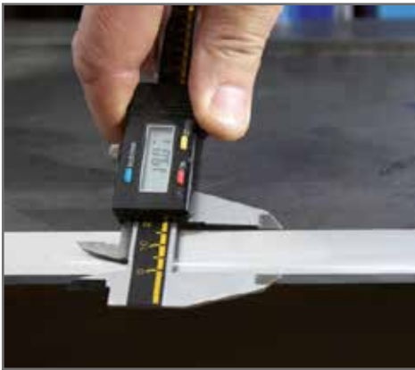
Fasenbreite max. 30 mm