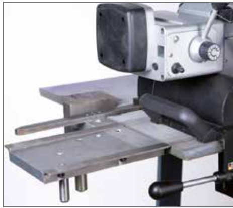
Führungsschiene der AutoCUT 500