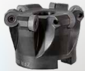
Zubehör Aufsteckfräser ZFR 500